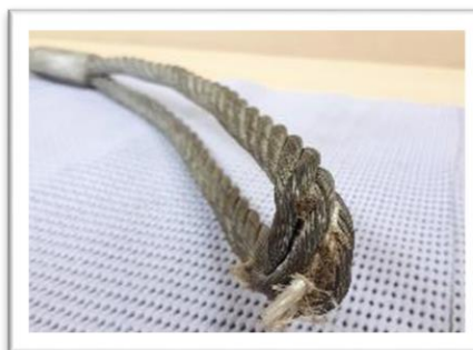
Aplastamiento de gaza. Presencia exterior del "alma"