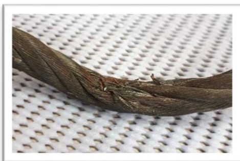
Rotura concentrada de alambres