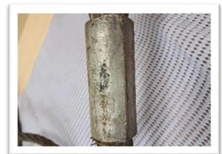
Borrado de información del casquillo