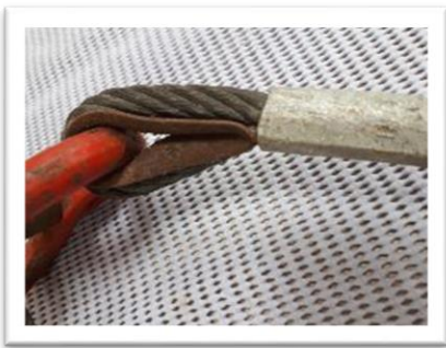
Óxido en guardacabos